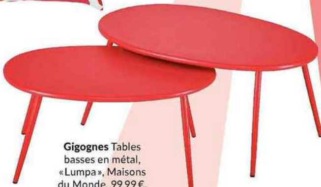
Gigognes Tables basses en métal, « Lumpa », Maisons du Monde, 99,99€.