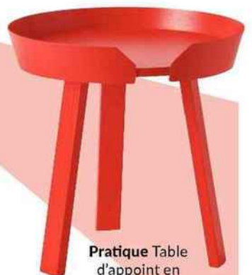
Pratique Table d'appoint en bois de chêne et de frêne, Ø 45 x H 46 cm, « Around », Muuto, 319€.

Glamour, énergisant, éclatant... même par petites touches, il réveille notre intérieur. Par Audrey Tartarat