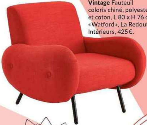
Vintage Fauteuil coloris chiné, polyester et coton, L 80 x H 76 cm, « Watford », La Redoute Intérieurs, 425€.