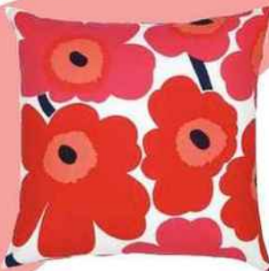
Fleurie Housse de coussin en coton, 50 x 50 cm, « Pieni Unikko », Marimekko sur Made in Design, 44€.